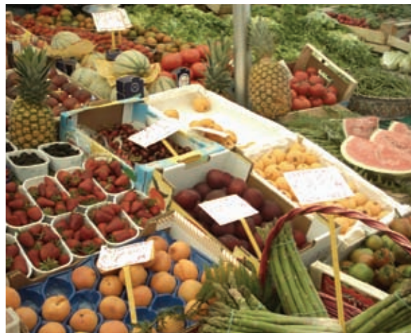
Današnji zahtjevi za raznolikijim prehrambenim proizvodima potiču šire korištenje biljne genetske raznolikosti

Kao pomoć europskim zemljama u odgovaranju na ove zahtjeve, Europska unija je 2000. godine odobrila financiranje projekta EPGRIS, Europska informacijska infrastruktura za biljne genetske izvore, kako bi se razvile nacionalne inventarizacije biljnih genetskih izvora (PGR) i formirao katalog za pretraživanje ex situ kolekcija u Europi – EURISCO. EURISCO katalog za javnost je objavljen u rujnu 2003., po završetku projekta, i do sada, tijekom njegove prve faze, dosegao je količinu informacija o gotovo jednom milijunu primki, uz stalni razvoj i održavanje mreže.